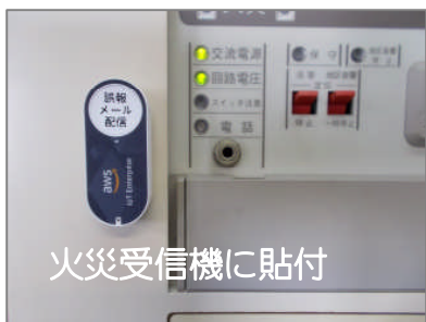
火災受信機に貼付

オストメールのボタンは、aws (アマゾン) IoT ボタンを採用しています。 幅 2.5-高さ 6.0-奥行 1.5cm 重さ 23g 壁貼付・吊下げ可能